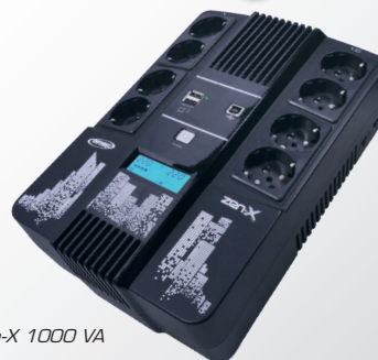
Zen-X 1000 VA