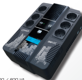
Zen-X 600 / 800 VA